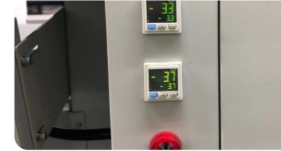
獨立高精度負壓控制系統，確保噴頭高質量噴射。