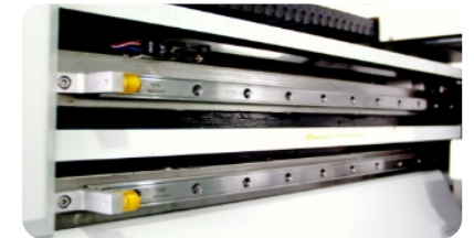
雙靜音導軌，具備優異的高速度，噴車運行更平穩，打印精度更高。