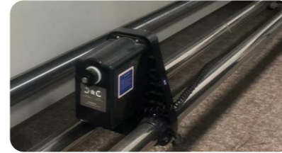
前置收紙器，方便後續加熱操作。