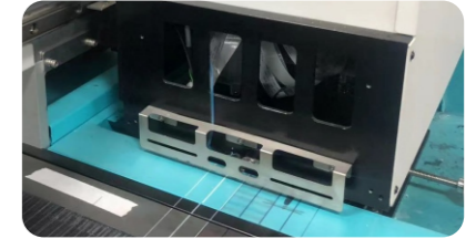
防撞系統有效對應打印過程中突發事件而對噴頭造成物理損傷。