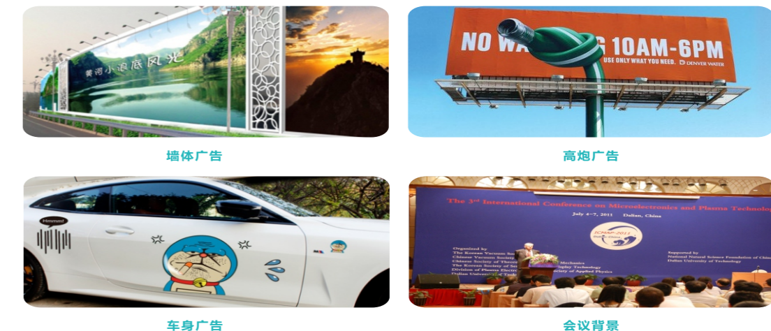
墙体广告 高炮广告 车身广告 会议背景