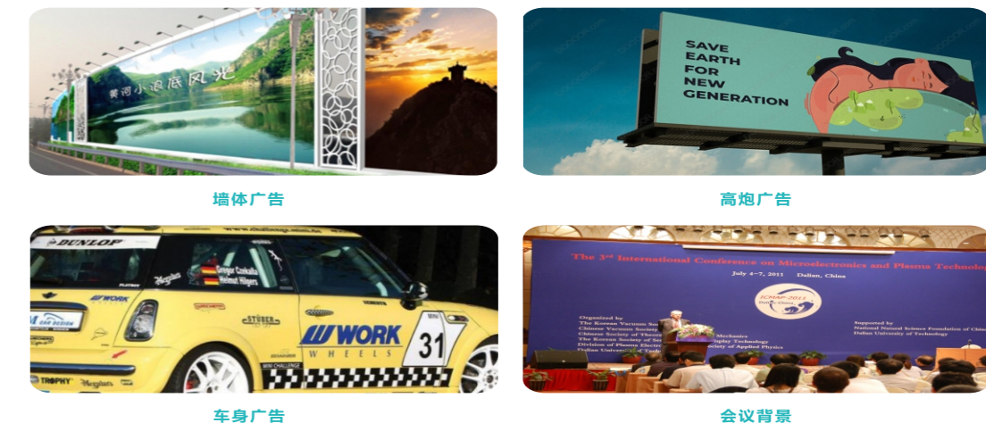
墙体广告 高炮广告 车身广告 会议背景